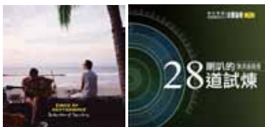
左 King of convenience - Declaration of Dependence 右 喇叭的28道試煉by音響論壇

當我一坐進皇帝位，整個音場跟結像感就十分強烈，我感覺聲音在我眼前發出，它倚牆而立，一人在左，一人在右。兩把吉他的聲音也可清楚分辨，既清楚又交匯，再搭配溫暖的歌聲，不禁閉上眼睛，只求享受這美好的音樂。而後我放進本刊劉總編的喇叭的28道試煉，選取其中第六曲Ravel的「水之嬉戲」。前所未有的感受直擊我的心靈，美妙輕盈的琴聲，一上一下、一起一落的在視聽間中展開，強大的結像感告訴我，不但鋼琴在我的眼前，那邊還有獨舞的水舞，琴聲化為一隻頑皮的精靈，它在空氣中跳躍、在空間中滑翔。我能聽到琴聲的共鳴、鋼琴槌敲擊琴弦的瞬間泛音，按到極高音時琴鍵落下回彈的微聲。SR 3 Avantgarde對細節的再生度是相當高的，高頻的延伸、低頻的下潛度都相當足夠。中頻則相當的自然，活生感十足，聽起來不會喧賓奪主，更讓本來就極優秀的錄音更加美妙。整體聽來，不但定位感強、結像清晰，給予人聽覺上的享受，頻段間平衡也是相當紮實，聲音相當傳真。