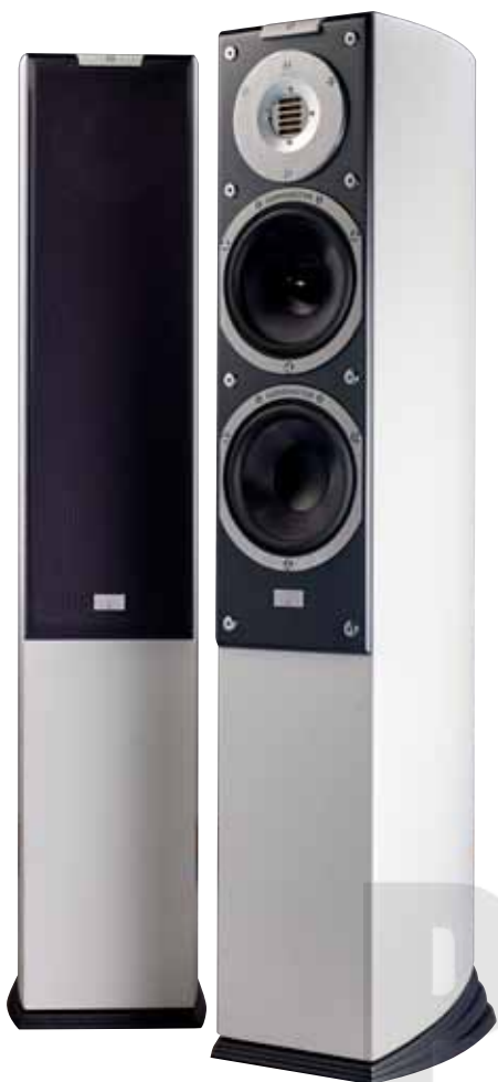
SR 3 Avantgarde左右聲道

●形式：三音路三單體低音反射式 ●單體：Avantgarde氣動式高音單體×1、6.5吋碳纖維複合振膜中音單體×1、6.5吋碳纖維複合振膜低音單體×1 ●頻率響應：26Hz-52kHz ●靈敏度：91.5dB ●分頻點：240 Hz、2900 Hz ●阻抗：8Ohm ●承受功率：300W ●尺寸：1030×190×330mm (H.×W.×D.) ●參考售價：359,000元(原木版)、397,000元(鋼烤版)