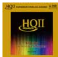
左 Marten - Supreme Sessions 1