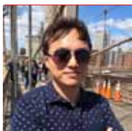
編輯 黃有場 聽感