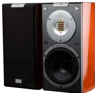
SR 1 Avantgarde環繞聲道

●形式：兩音路兩單體低音反射式 ●單體：Avantgarde氣動式高音單體×1、6.5吋碳纖維複合振膜中低音單體×1 ●頻率響應：41Hz-52kHz ●靈敏度：87.5dB ●分頻點：2900 Hz ●阻抗：8Ohm ●承受功率：180W ●尺寸：370×190×280mm (H.×W.×D.) ●重量：22kg ●參考售價：169,000元(原木版)、197,000元(鋼烤版)