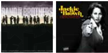
左 Band of Brothers O.S.T. 右 Jackie Brown O.S.T.

一開聲聽沒多久我就發現這對喇叭的質非常好，聲底純淨、音質精緻，音樂的還原性相當高，沒有太多的音染，可以讓用最乾淨的音質來了解各頻段的個性。我認為SR 3 Avantgarde聲音有兩個很值得推崇的地方，第一是解析力強，第二是可創造開闊的音場。先來談解析力，剛剛說的質好其實就說明了它具有很出色的細節描繪功力，而且厲害的不光是中高頻段蘊含龐大的資訊量，低頻不僅量感強、速度快、Punch結實飽滿，乾淨的低韻還可以讓我聽到藏在其中的細膩聲音，Bass演奏時Q軟的節拍還能聽到撥弦跳動的幅度，讓爵士樂隨興的旋律就此被賦予活生的靈魂，很有臨場效果。另外就是別看SR 3 Avantgarde外型優雅秀氣，它可以創造很大的音場效果，尤其是聽編制較大的室內樂、現場演唱會或者電影配樂，更可以感受到喇叭創造的偌大空間效果，樂器、人聲的定位也十分明確，強化音場縱深效果，所以聆聽時你會感覺到這似乎是體積更大的喇叭所發出來的聲音。細究音質，SR 3 Avantgarde高頻解析力強，有光澤，明亮充滿朝氣。中頻凝聚力佳，不會過度豐腴，人聲表現相當中性。低頻速度、量感、力道三方兼具，表現適中，三頻整體平衡性相當好。整體感覺這對喇叭沒有太多的音染，聲音表現上非常傳真，喇叭也蠻好驅動的，就算搭配一般等級的環繞擴大機或者綜合擴大機，就可以發出出很高的效率，好搭又好聽。